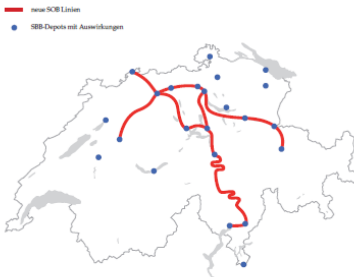
Die Idee der Kooperation Neue produktive Verteilung der Leistungen